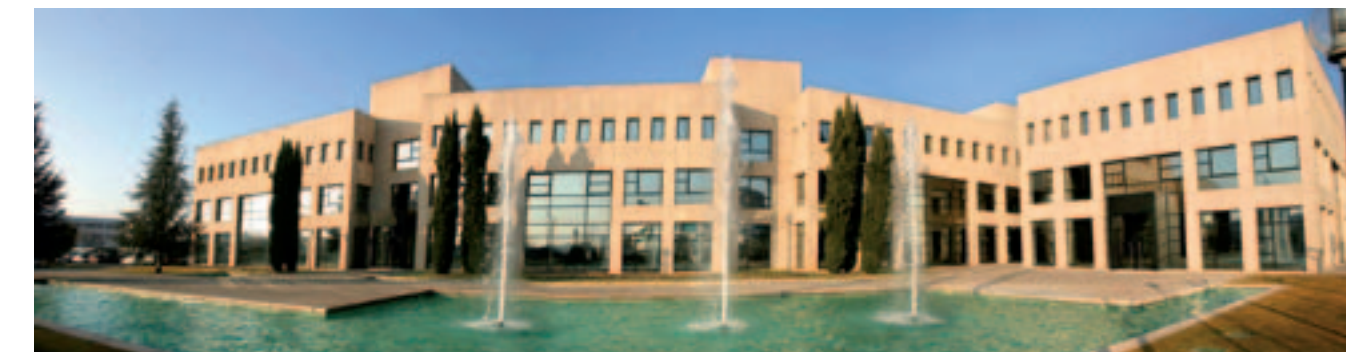
SENER offices in Madrid. / Oficinas de SENER en Madrid.

Finally, the Aerospace Division is mainly centred on the area of gas turbines for aeronautical propulsion.