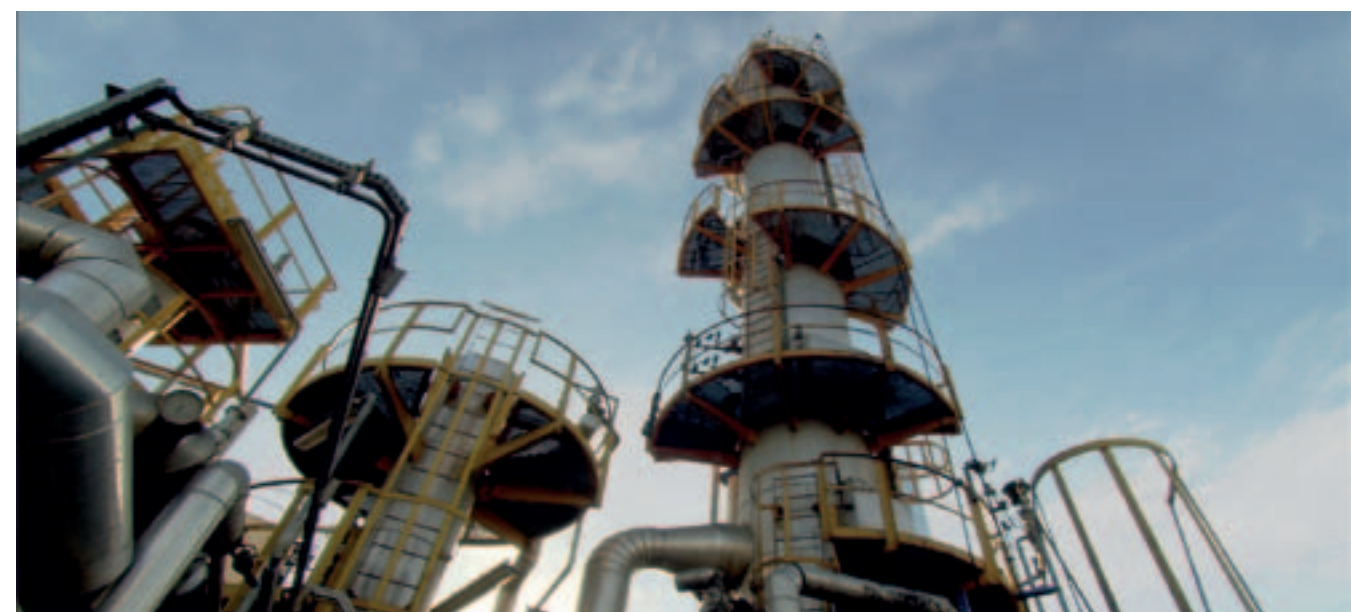
ECOLUBE's Plant, 30.000 t/y (Fuenlabrada, Spain). Distillation area. / Planta de ECOLUBE, 30.000 t/a (Fuenlabrada, Madrid, España). Área de destilación.

Área de Energía y Medio Ambiente Severo Ochoa, 4 (P.T.M.) 28760 Tres Cantos MADRID - SPAIN Tel.: +34 91 807 70 00 Fax.: +34 91 807 72 12 dep.ambiente@sener.es