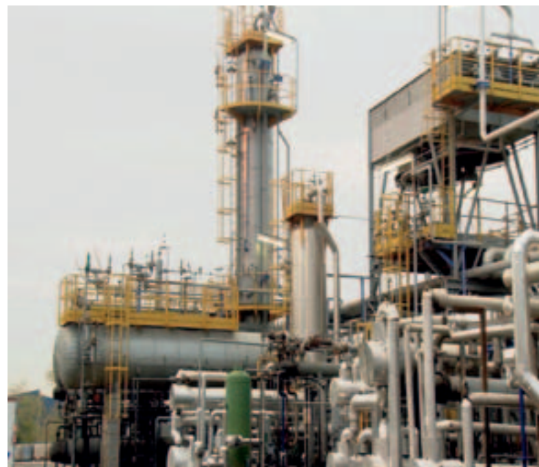
ECOLUBE's Plant extraction area. / Planta de ECOLUBE, área de extracción.

Three base oils are separated at different levels in the fractionating columns: SN80, SN150 and SN350. They are completely finished and have the same quality as the lube bases obtained directly from crude oil.