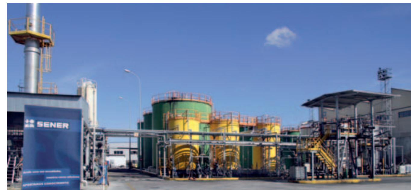
ECOLUBE's Plant storage area. / Planta de ECOLUBE, parque de almacenamiento.

Las bases lubricantes producidas mediante el Proceso SENER, debido a su alta calidad, no precisan de ninguno de los tratamientos convencionales de acabado, ni por hidrogenación, ni por ácidos y tierras, por lo que permite realizar un tratamiento más ecológico a un coste más reducido.